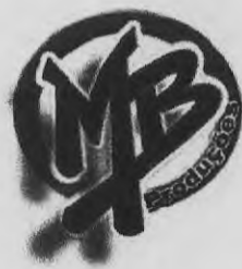
TABELA DE PREÇOS JANEIRO/DEZEMBRO DE 2017