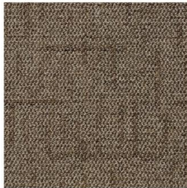
Figura 1: Carpet em rolo, linha Cross, modelo Traffic

Será adotado o revestimento Carpet em rolo, da linha Cross, ref. 709 - Traffic, Marca Belgotex ou similar para a área de passagem da público (laterais e centro). Tal adoção deste material se faz pelo elevado coeficiente de absorção sonora, que será capaz de atenuar o ruído causado pelo impacto do caminhar das pessoas. O material é altamente durável e fácil de manter, com espessura de 6mm.