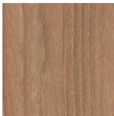
Figura 2: Painel liso MDF, Savana, marca Guararapes

Painel em MDF, com espessura de 20mm, na cor Savana, marca Guararapes ou similar com ressaltos e iluminação indireta. A adoção desses painéis proporciona a melhora da inteligibilidade, clareza e definição sonora dos ambientes, além de contribuir para quebra do paralelismo dos ambientes. Sendo assim, foi utilizado ao longo do comprimento do plenário.