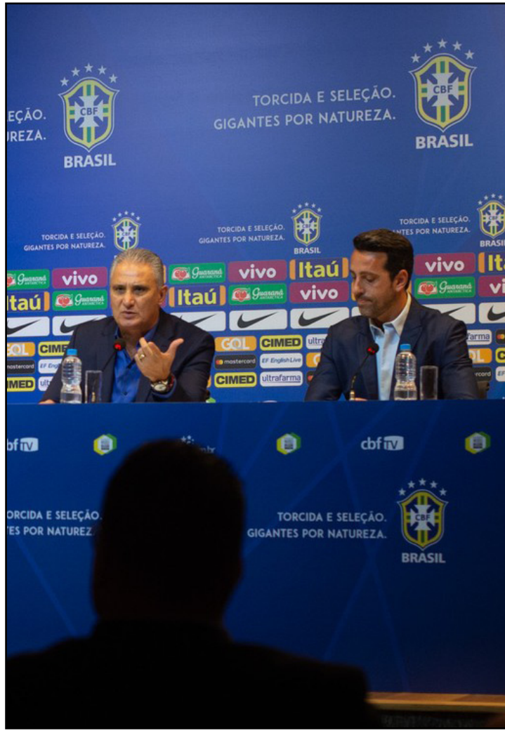
Tite anunciou convocação nesta sexta

“A primeira fase consideramos curto prazo, a segunda, médio prazo, a terceira longo prazo. Entendemos que o curto prazo, as convocações terão leque maior de observação para potencializar equipe para a Copa América. Curto prazo estimo até janeiro. O médio prazo consideramos do final de dezembro até a Copa América, já com menos observações. Da Copa América em diante, já consideramos longo prazo”, afirmou. Tite realizou uma rodada de observações nos últimos 15 dias, com membros da comissão acompanhando 13 jogos, entre Brasileiro, Sul-Americana, Copa do Brasil e Libertadores. Houve a preocupação de não desfalar as equipes brasileiras, com a convocação de no máximo um atleta por clube.